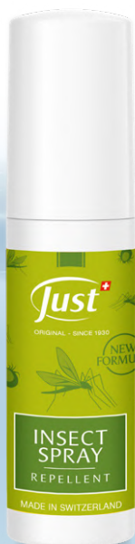
INSECT SPRAY Für die ganze Familie. Wirksam gegen Gelsen und Zecken. 75 ml - Art. 3976

Wie Eucasol mit seiner unnachahmlichen balsamischen Intensität, die man beim tiefen Durchatmen genießen kann.