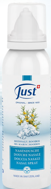
NASE FREI SPRAY* Hilft, die Nasenhöhlen sanft von Verunreinigungen zu befreien, schützt die Nasenschleimhäute und fördert die richtige Atmung. Mit Meersalz aus der Bretagne, Mariendistel, Rooibos und Koriander. 100 ml - Art. 3718