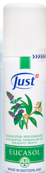
EUCASOL Das legendäre Just Spray mit ätherischen Ölen für ein umhüllendes, intensiv balsamisches Wohlgefühl. Mit Eukalyptus, Kiefer, Minze. 50 ml - Art. 3580